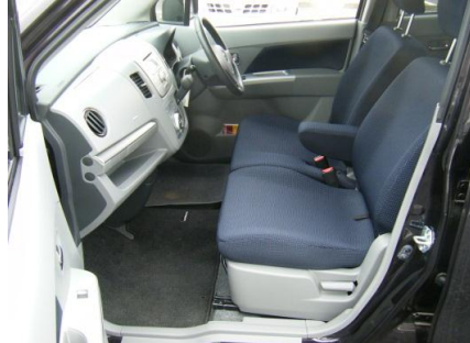
助手席座面を持ち上げ背もたれを倒すとフラットに