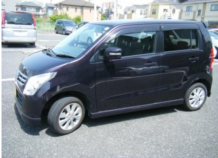
軽自動車一番人気のワゴンR

普段 足代わりに使用している、ワゴンRをソロキャンプに使用できないかと考え座席を倒したりしていると、助手席が平らになるのを発見！ 助手席側の長さを測ると約1.9m 幅も55cmとバッチリ！ そのまま寝ると背中・腰が痛くなりそうなので、簡単に設置取外しできる簡易ベットを作ることにしました。快適に寝る事だけに特化し、余分な設備などは取付けない事にして、ベース車にはネジなどで加工しない事にしました。