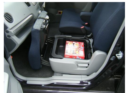
助手席下部は収納スペース

移動時 又は、使わないときは簡単に収納可能 ネジなど使用しないで、雨の日も車内で簡単に組立が可能