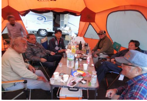
テントの中でまったりと・・・