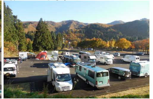
最高の天気でしたので、青空の下で乾杯です。 \(\^o^)/