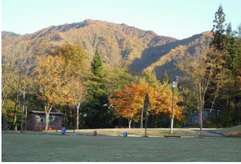
今年も綺麗でした

最高の天気でした。 \(\^o^)/ まったりと〜ビールを片手に紅葉を眺めたあとは、天の川を見上げながらコシヒカリとキノコ汁・・・ 17台集合しました！