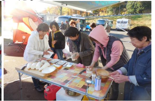
今晚のお鍋を皆で作っています。