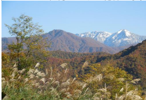
お山は、雪化粧です