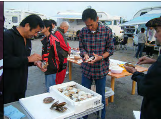
ホタテを向いているおじさんたち