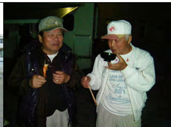
仲良くキャンプ談義中