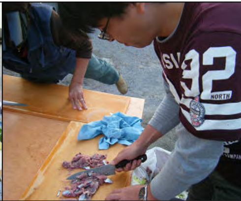
サンマを叩いているレンジャーさん