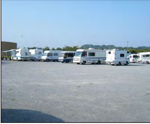
大洗海浜公園 特設キャンプ会場