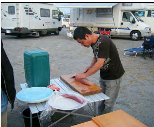
刺身を沢山作っていただきました