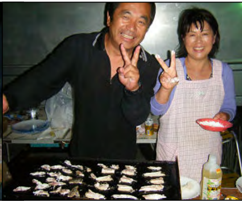
香港帰りの本家さん