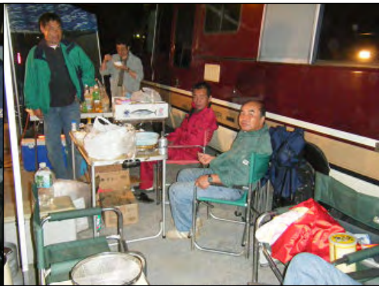
五番街のみなさん