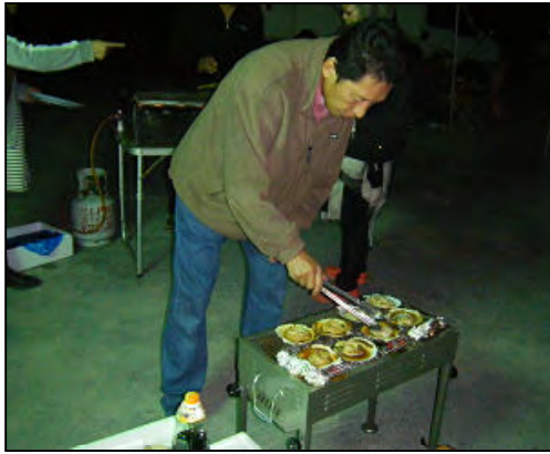
ホタテの焼き方は任せてね