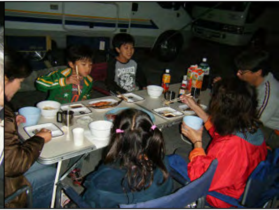
子供たちも一緒に仲良く