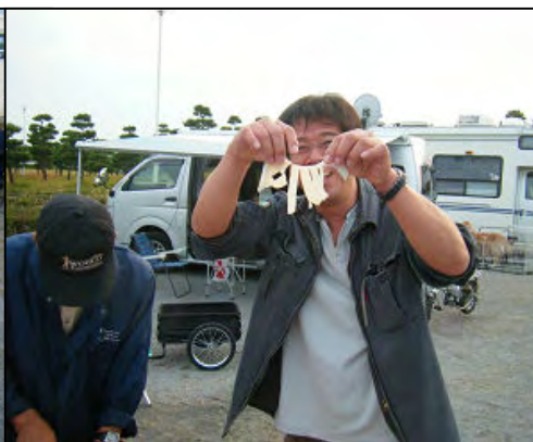
ハリーさんのイカソーめん??