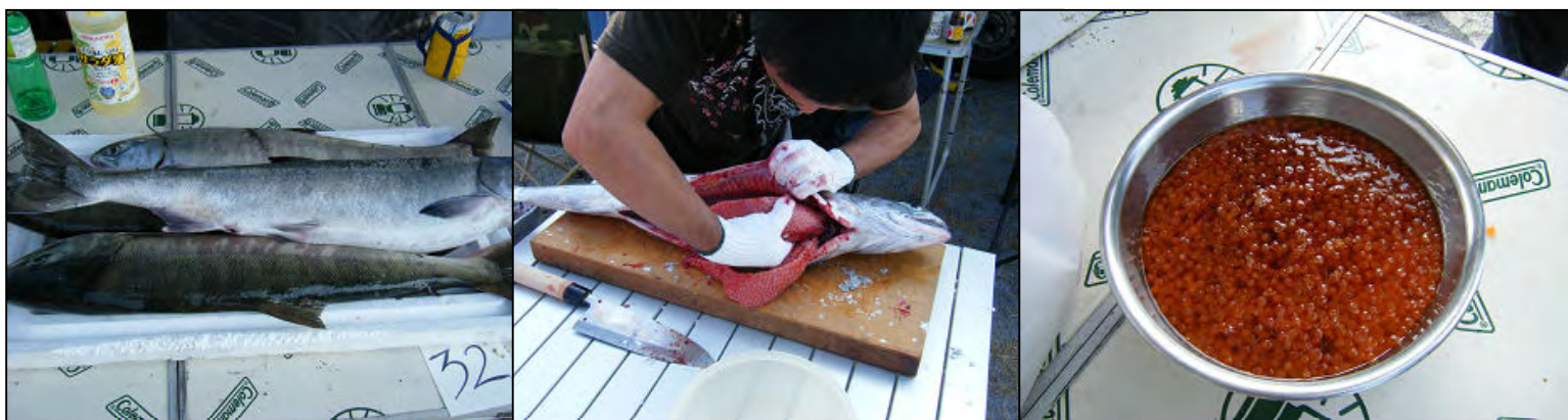
メスが2匹、オスが2匹で、メスの子はイクラご飯で頂きました。オスはチャンちゃん焼きとお刺身に・・・残りは切り身にしてお土産が出来ました。