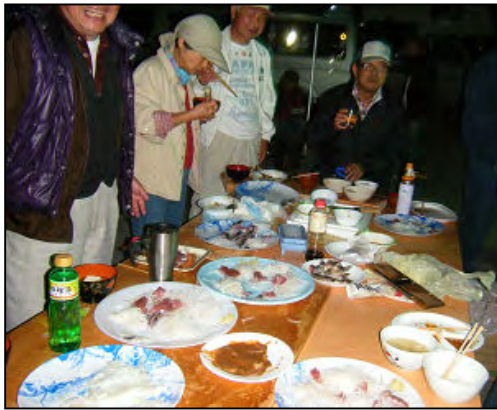
大きなテーブルに沢山のお刺身