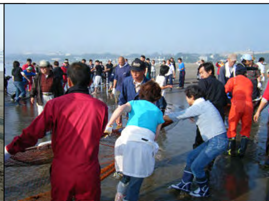
みんなで8時から地引網