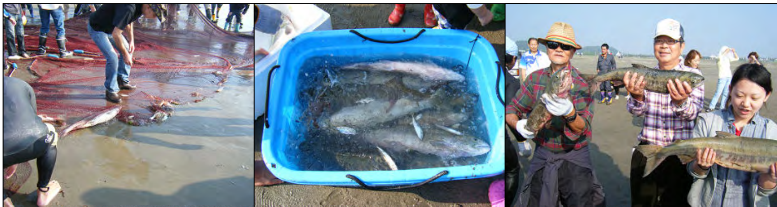
今年は鮭が10匹以上と大漁でした・・・我がHMCCには4匹の分配がありました