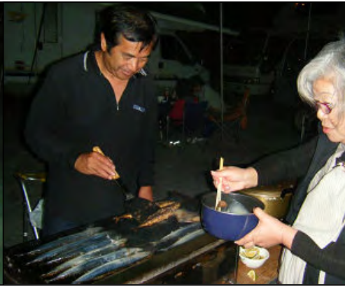
今回は鉄板でサンマを焼きました